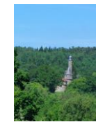
La Tour de Bonvouloir