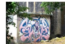
Sur le GR 22