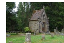
Chapelle Sainte Genevieve