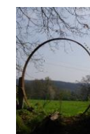
Vues sur les parcours